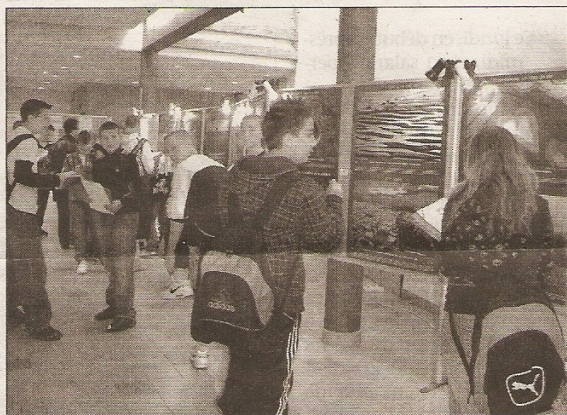
Les élèves ont eu des questionnaires à remplir

Le travail réalisé par trois élèves de 3e a eu les honneurs de la chaîne télévisée LCI.